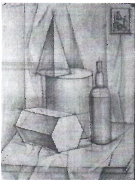
Рисунок 1. Натюрморт. На выполнение задания отводится 3 часа.

На формате А2 построить композицию из 3-5 геометрических тел согласно постановке: Конструктивно-линейное построение геометрических тел с учётом наблюдательной перспективы.