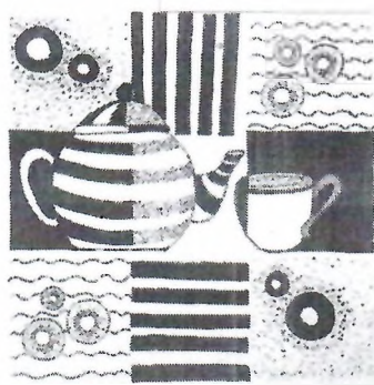
Рисунок 2. Декоративная композиция на тему: «Мое увлечение».

Материалы. Бумага формата А-2; графитные карандаши различной твердости: НВ, В1, ластик, точилка, салфетки (ветошь).